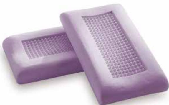
mod. ORTHOMASSAGE cm.70x39x10