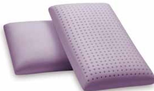
mod. SAPONETTA MAXI