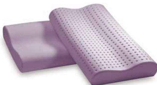
mod. ORTHOCERVICALE cm.69x41x10/11