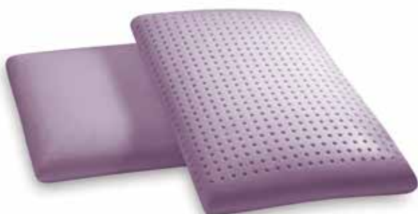
mod. AMERICA cm.76x51x12