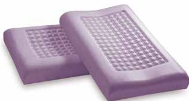
mod. ORTHOMASSAGE BIG cm.70x39x10