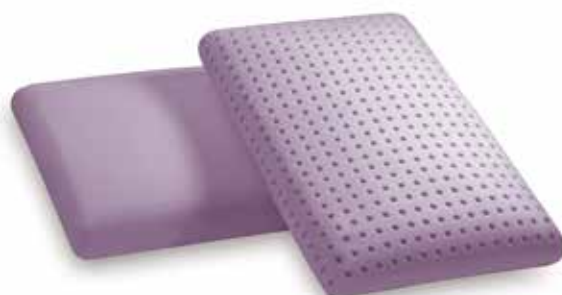
mod. PORTOGALLO cm.60x40x12