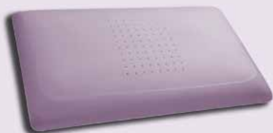
piccolo lavorazione Ø 4 mm.