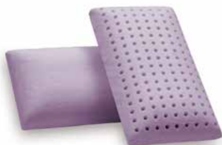
mod. VIAGGIO cm.43x23x11