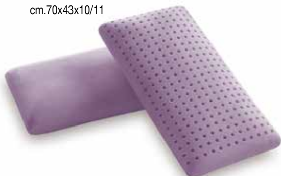
mod. SAPONETTA PICCOLO