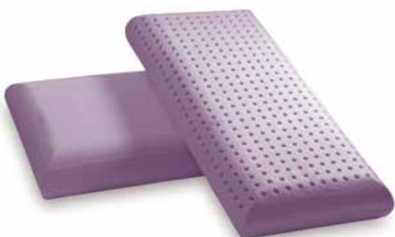
mod. BOMBATO cm.73x34x14