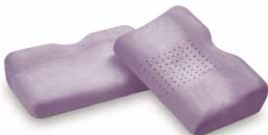
mod. JAP cm.43x32x6/12 cm.53x32x6/12