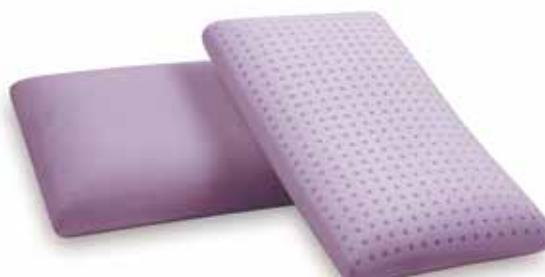
mod. SPAGNA JUNIOR cm.60x34x12,5 cm.68x34x12,5 cm.88x34x12,5 cm.133x34x12,5