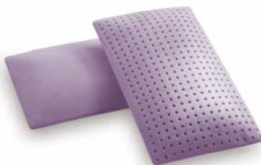
mod. SLIM cm.34x60x7,5