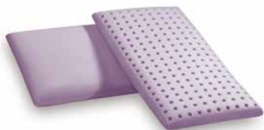
mod. BABY cm.50x26x5