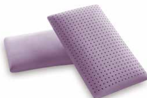
mod. SAPONETTA GRANDE