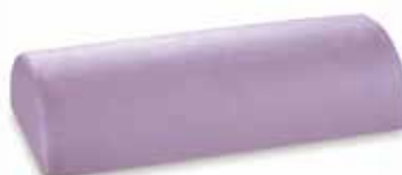
mod. MEZZO CILINDRO