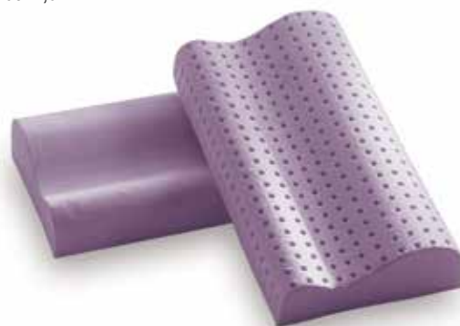
mod. CERVICALE PICCOLO cm.50x31x8/11 cm.55x31x8/11 cm.60x31x8/11