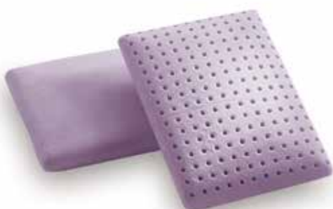
mod. FRANCIA cm.30x40x8