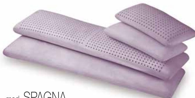
mod. SPAGNA cm.60x35x14 cm.70x35x14 cm.75x35x14 cm.80x35x14 cm.90x35x14 cm.105x35x14 cm.135x35x14 cm.150x35x14