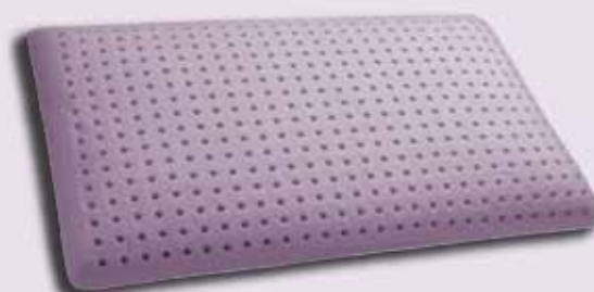
grande lavorazione Ø 10 mm.