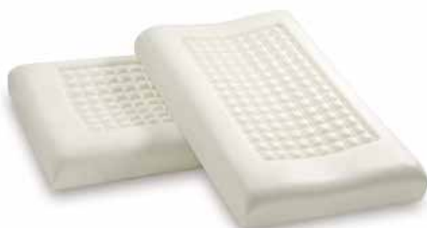
mod. ORTHOMASSAGE BIG cm.70x39x10