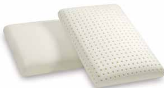
mod. PORTOGALLO cm.60x40x12