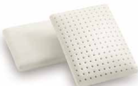
mod. FRANCIA cm.30x40x8