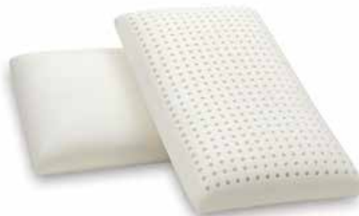
mod. SAPONETTA MAXI