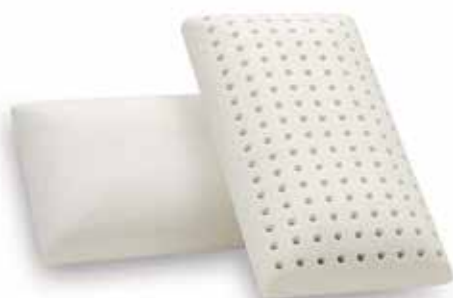
mod. VIAGGIO cm.43x23x11