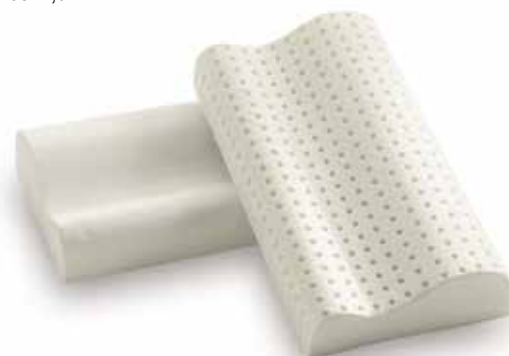
mod. CERVICALE PICCOLO cm.50x31x8/11 cm.55x31x8/11 cm.60x31x8/11