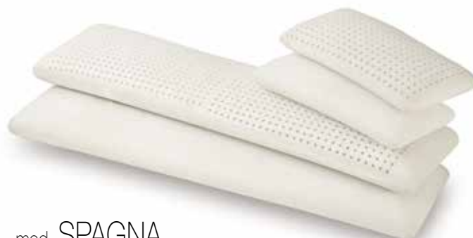
mod. SPAGNA cm.60x35x14 cm.90x35x14 cm.70x35x14 cm.105x35x14 cm.75x35x14 cm.135x35x14 cm.80x35x14 cm.150x35x14