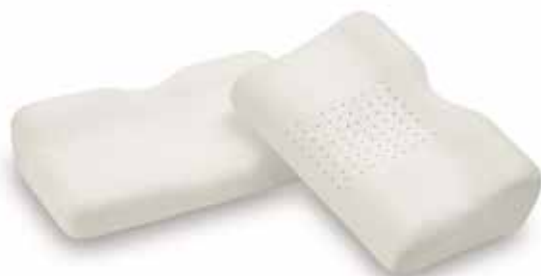
mod. JAP cm.43x32x6/12 cm.53x32x6/12