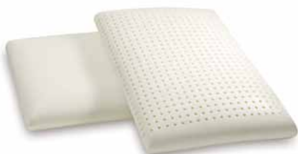
mod. AMERICA cm.76x51x12