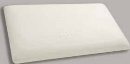
piccolo lavorazione Ø 4 mm.