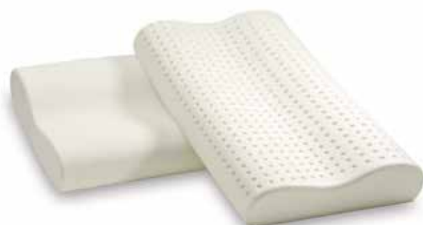
mod. ORTHOCERVICALE cm.69x41x10/11