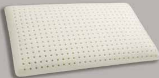
grande lavorazione Ø 10 mm.