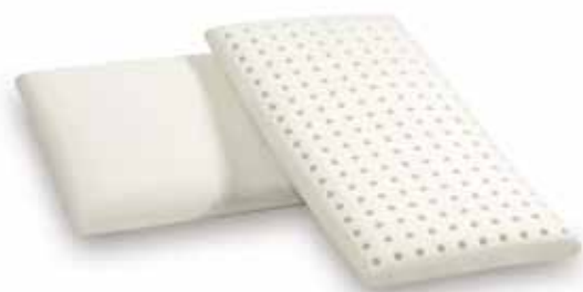
mod. BABY cm.50x26x5