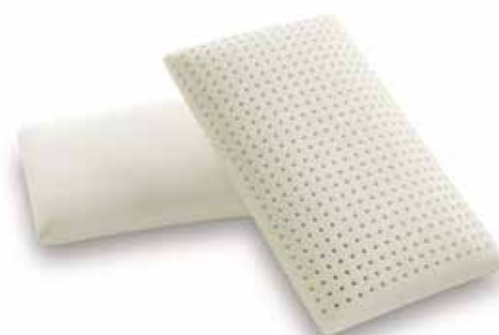
mod. SAPONETTA GRANDE