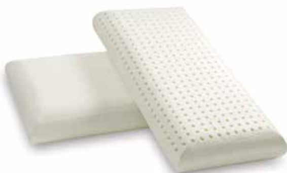
mod. BOMBATO cm.73x34x14