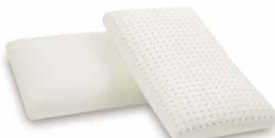
mod. SPAGNA JUNIOR cm.60x34x12,5 cm.68x34x12,5 cm.88x34x12,5 cm.133x34x12,5