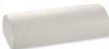
mod. MEZZO CILINDRO