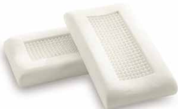
mod. ORTHOMASSAGE cm.70x39x10