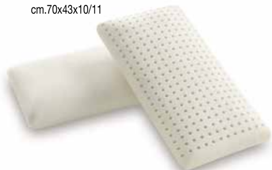
mod. SAPONETTA PICCOLO